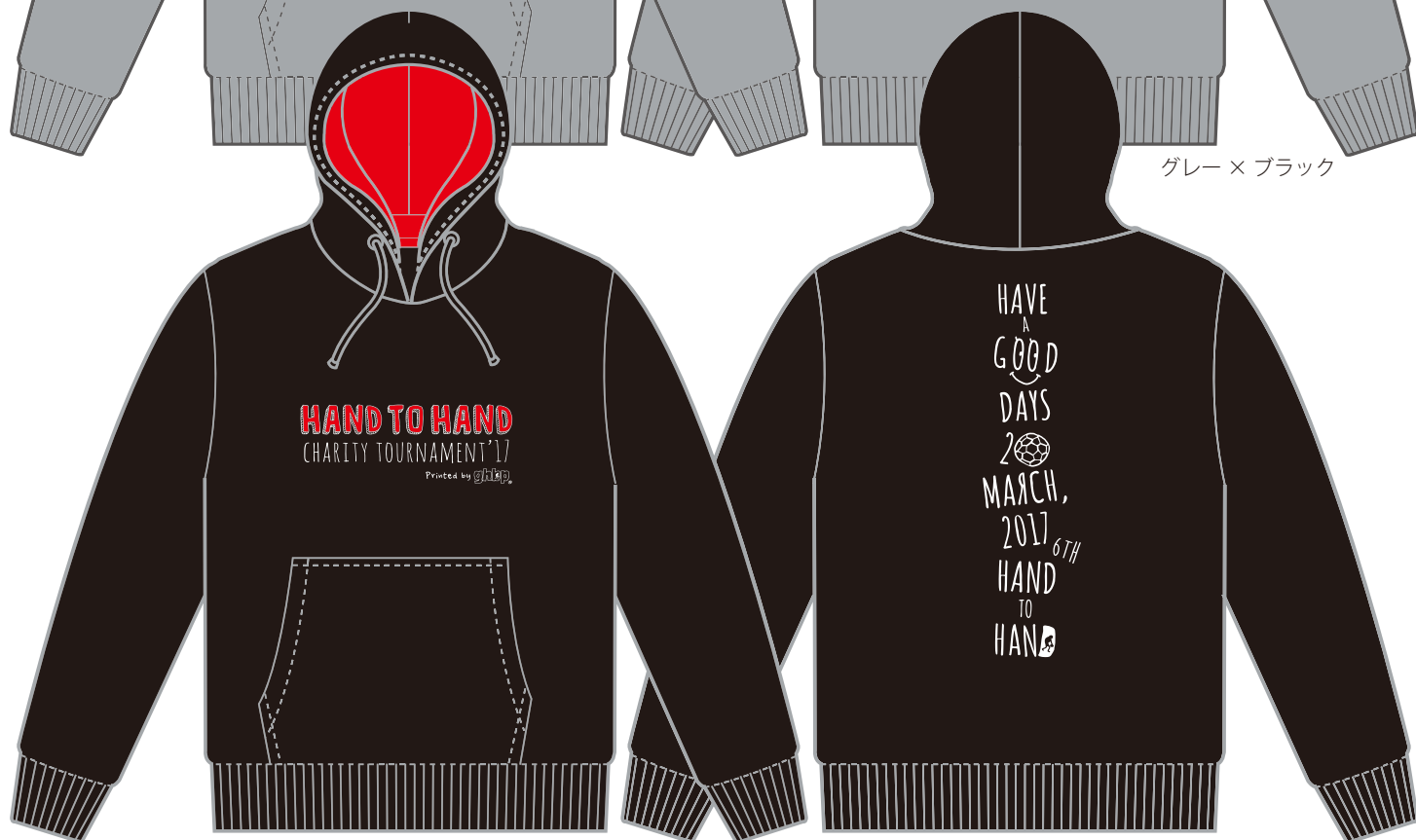
ブラック × レッド